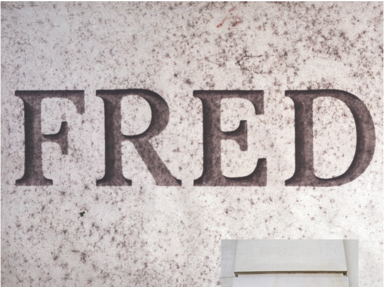
Udsnit af hugget gadeskilt på Amalienborg - Frederiksgade